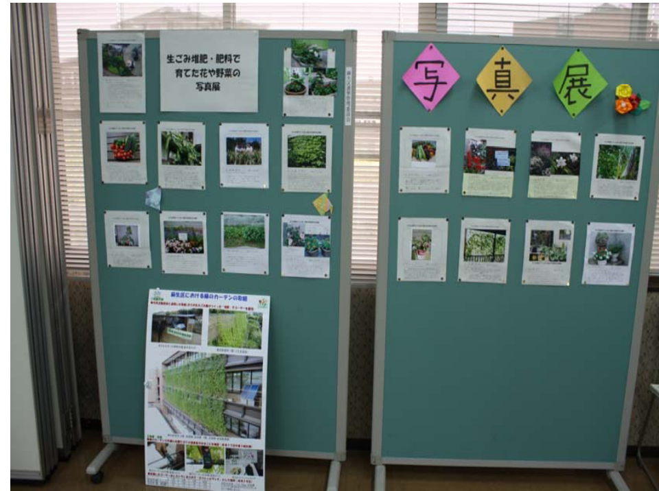
写真展の様子(応募19作品)