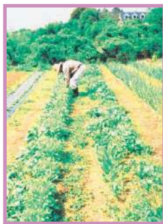
営農団地 総面積35.6ha。柿、りんごなど実り豊かな果樹園と畑が広がる

柿生駅(南口)⇨あさおふれあいの丘⇨東光院宝積寺⇨岡上神社⇨熊野神社⇨高蔵寺⇨白坂横穴古墳群⇨恩廻公園調節池⇨月読神社⇨浄慶寺⇨柿生駅(南口)