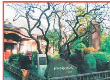
星宿山王禅寺 関東の高野山とよばれる古刹。老松古杉が繁り、静寂そのものの本堂の庭に柿寺丸柿の原木がある