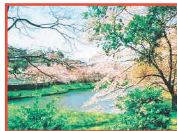
籠口の池公園 かつての灌漑用水池は、現在調整池になっている。桜の名所