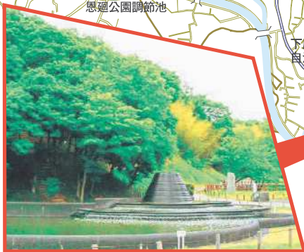
早野聖地公園 標高40~80mの丘陵に3本の谷戸が入り込み、7つの池が点在する