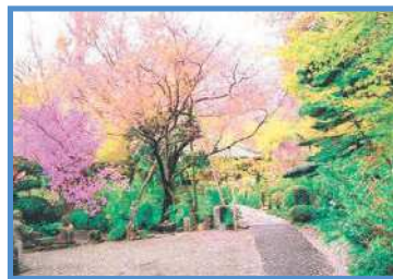
浄慶寺 東京小石川丘通院の法類寺院。あじさいと山桜でも知られている