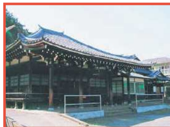
麻生木賊不動尊 1月28日はだるま市で賑わう。「火ぶせ」の不動ともいわれている