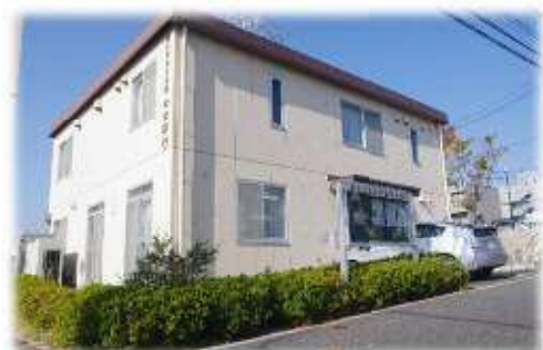
麻生市民交流館やまゆり