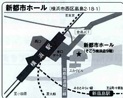
■ 交通 各線「横浜駅」徒歩5分