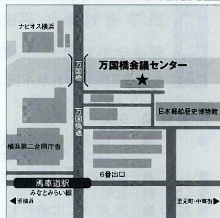
■ 交通 みなとみらい線「馬車道駅」6番出口徒歩4分