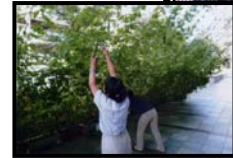
昨年度の受賞作品