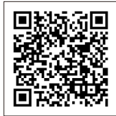
かわさきのお医者さん (パソコン版トップページ)

http://www.iryu-kensaku.jp/kawasaki/mobile/