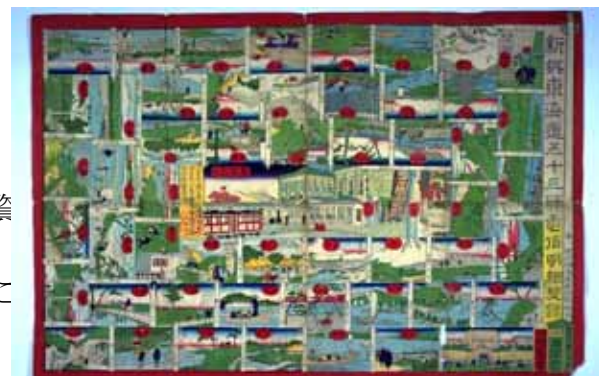
東海道五十三次のすごろく