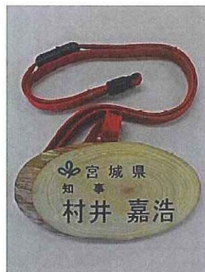
吊り下げ名札見本