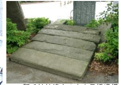
稲毛神社境内の小土呂橋遺構