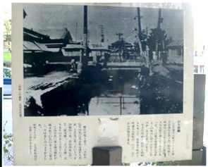
案内板（昭和6年、埋められる直前の頃の新川堀と小土呂橋）