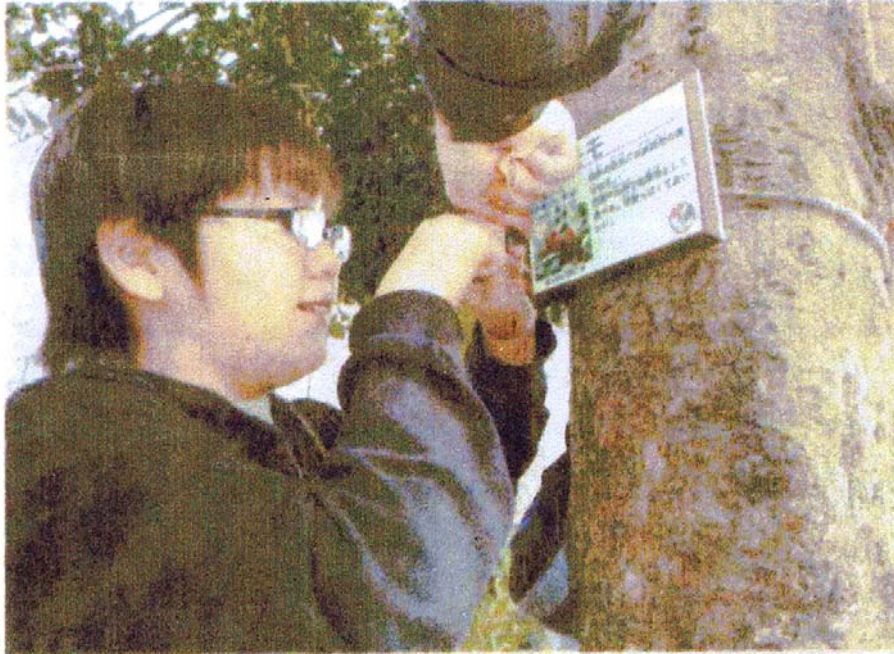
木に名前や説明の入ったプレートを付ける児童

身近な公園にある木に親しんで 川崎市川崎区京町の京町公園で、 もらおうと、川崎西部まちづくり 京町小学校児童と共に、木に名前 クラブ（篠原倫彦代表）は7日、 などを書いたプレートを付けた。