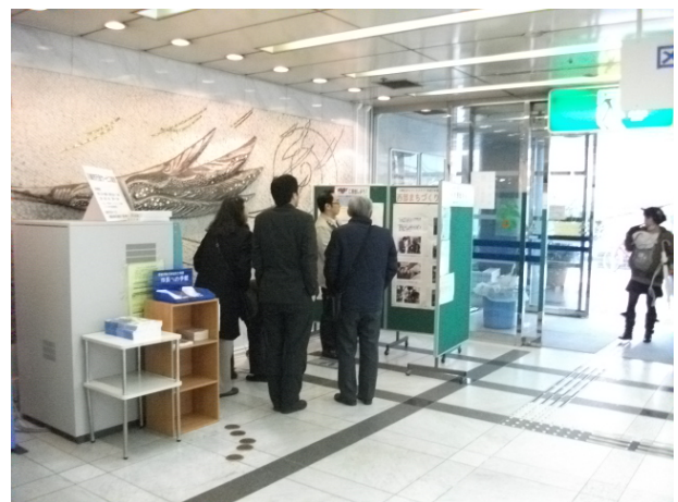
展示の様子(区役所入り口のそばで展示)