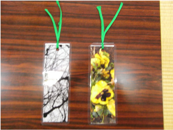
こんな作品（しおり）ができました