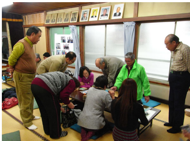
みんなで楽しく作業しました。