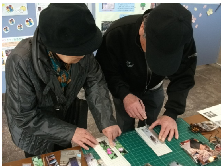
体験コーナーでしおりづくりに取り組む来場者