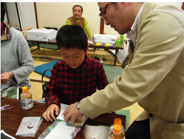
ブックカバーづくりに取り組む少年