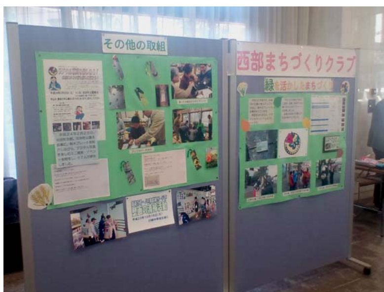
西部まちづくりクラブの展示

また受付のそばに、デジタル写真をつかったしおり、ブックカバーの工作の「体験コーナー」を設置し、当番クラブ員を中心に運営を行いました。展示期間中、このコーナーでオリジナルのしおりづくりに取り組む来場者の姿が見られました。