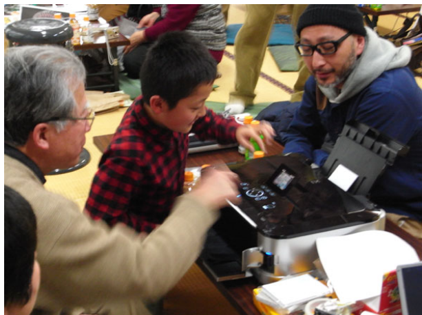
撮ったばかりの写真をプリント