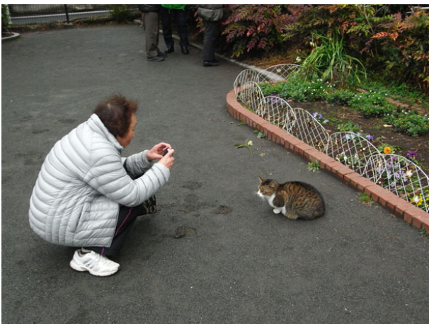
池田町公園での撮影会

そして雨がちょうど止んだので、最寄りの池田町公園で撮影会、その後は再び町内会館に戻って、撮影した写真をお互いに観賞しあったり、その場で印刷し、ブックカバーやしおりの作品に仕上げました。