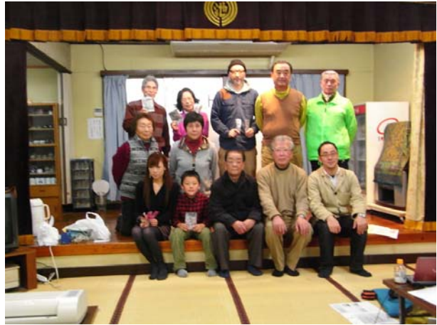
さいごに記念写真