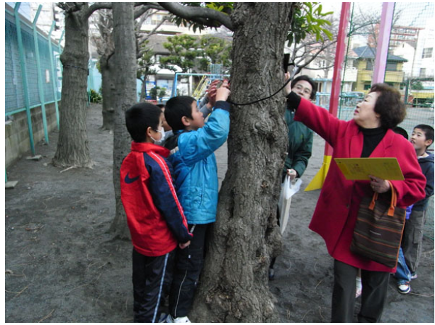
■2月15日（火） 下並木公園樹木プレート設置活動 川崎中学校生徒が参加