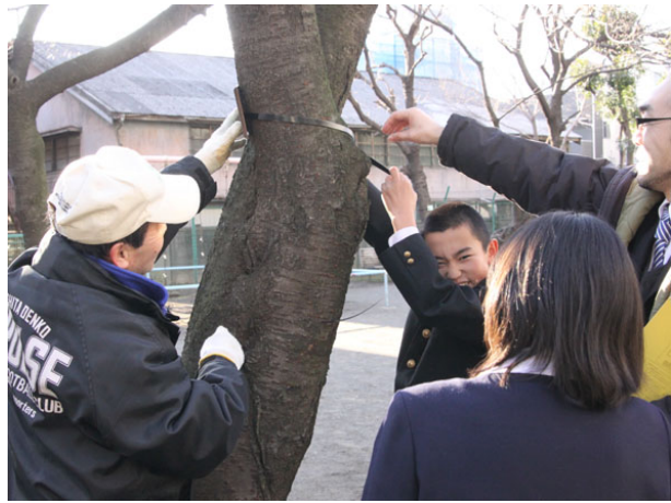
■2月16日（木） 南町公園樹木プレート設置活動