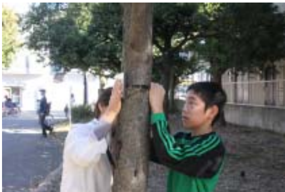
樹木プレート設置作業