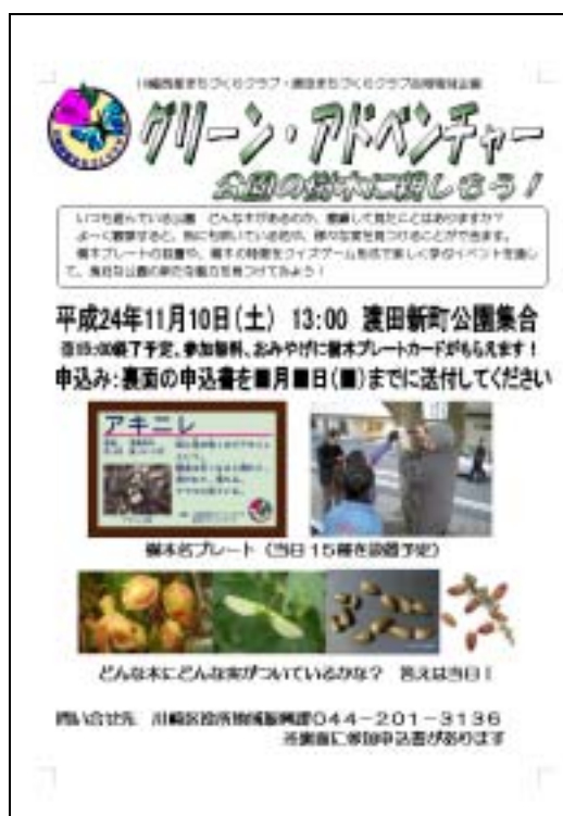
イベント告知・参加者募集に使われたチラシデザイン

出題内容については、コンサルタントのたたき台を基にクラブ員で検討・決定し、「樹木の観察 さがしてみよう!」と題した「木の実編」「木の葉編」「木の皮編」の3種類各4問の出題シートが完成した。また、参加者への記念品として、当日設置した樹木プレートのデザインを名刺大に縮小印刷し、ラミネートしたカードを作成し、配付することとした。カードの裏面には、サイコロの目やじゃんけんの画像を印刷し、カードを使って遊べるように工夫した。