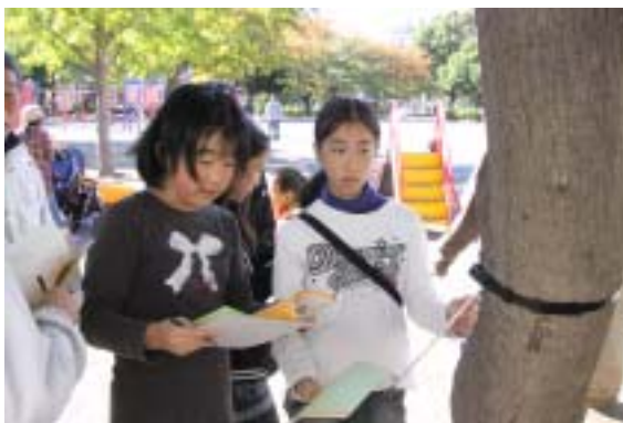
答えの樹木を探す子どもたち