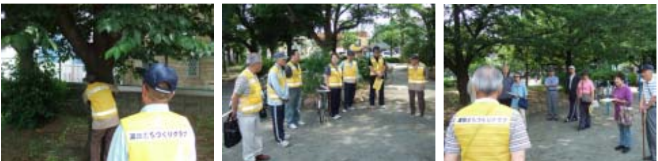
渡田まちづくりクラブと合同で行った樹木調査の様子

その後の検討の結果、場所の確定できなかったヤエザクラ、樹種の確定にいたらなかったツバキ / サザンカについては、設置を見合わせる事となり、最終的に 13 種 13 本の樹木に樹木プレートを設置することとなった。