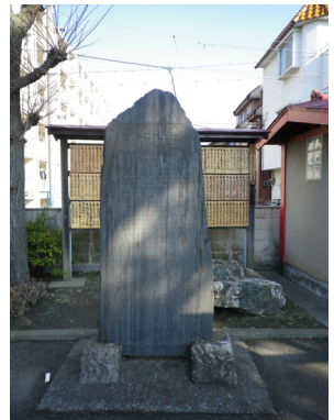
左上：接ぎ木される伝十郎桃の枝 右上：春の若葉 左下：冬芽 右下：記念碑（大島八幡神社境内）