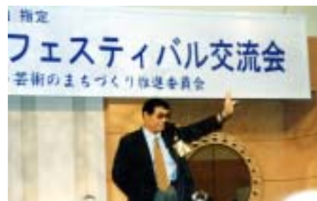
市民映画祭の勝利宣言

1997年の春、視覚障害者の方から電話がかかってきました。「私たちも映画が見たい映画祭に参加したい」との申し込みでした。私たちはびっくりし、困惑しました。そこで直接お会いし話を聞くと、映画のアクションをト書きに直せば音声で聞けるというのです。<A子、顔を覆って泣く><B男、そっと彼女を抱く>そうした画面上のアクションを瞬時に読みあげFM電波で飛ばし、観客がイヤホンで聞いて画面を想像する方法です。これは、今日では全国に普及していますが、13年前は誰もやっていなかったもので、映画祭スタッフが半年がかりで完成させました。ただ、こうした脚本の書き換えはシナリオライターの著作権に触れるので、勝手に名作を使用する訳にはまいりません。使用料も莫大に掛かります。困った揚句、今村さんに頼み込んでカンヌグランプリを受賞した「うなぎ」を使わせて貰いました。このバリアフリー映画鑑賞法は、川崎から全国に拡がって行った誇るべき「しんゆり映画祭」の成果だと思っています。