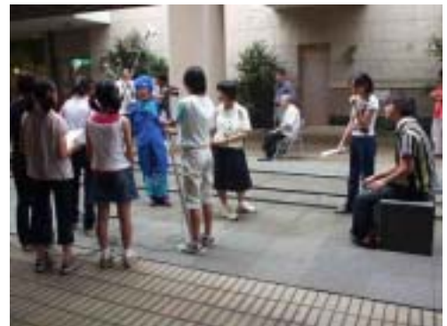
ジュニアワークショップ風景

指導講師が、<先生が入ってきて来て、生徒がだらしないと叱るだろう>と叱り方を指導をしていると、女の子が<違うんだよ>と反論します。彼女は、<相手が新人教師だと、生徒の方が先生を馬鹿にする>というんですね。なるほど、ベテランの副校長と新米の女性教師では生徒達への威圧感が違う。つまり、指導しているプロの映画監督が、中学校の実態を生徒たちから学ぶわけ