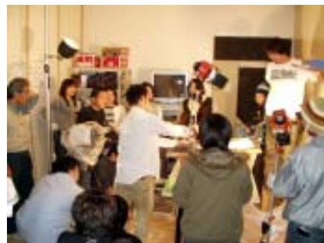
「雪ぼらけ」撮影風景

東北から川崎のネジ工場へ働きに出てきた青年は孤独です。飲み屋で知り合った同郷の彼女はお見合いで帰ったきり音沙汰なしです。一緒に勤めた友人も帰郷してしまい、青年は次第にノイローゼになって、仕事の最中にネジが頭の中に出てくる幻覚に苦しみます。その揚句に怪我をして部屋の中に閉じこもるが、ヤケ酒を飲んでいるうちに故郷の雪景色の幻想を見ます。「もう駄目だ！田舎へ帰ろう」工場を辞めた青年がバスに乗ろうとしたとき、携帯が鳴り、川崎へ戻ってきた彼女の懐かしい声が聞こえてきます。「工場を辞めるって？あんた職人だろう、男だろう！？」彼女に励まされ、青年は眉を上げて元来た道に戻ってゆきます。9分の短い時間でこれだけのドラマを書くのは至難の業です。