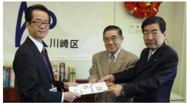
第3期区民会議魚津委員長(右)、島田副委員長(中)から区長(左)へ報告