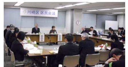
第 4 期川崎区区民会議全体会議の様子

平成 24 年 4 月より、第 4 期川崎区区民会議がスタートしました。第 3 期での取組を踏まえ、20 人の委員が地域課題の解決方法を審議します。