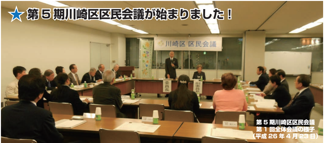
第 5 期川崎区区民会議 第 1 回全体会議の様子 (平成 26 年 4 月 23 日)

区民会議とは、暮らしやすい地域社会をめざして区民のみなさんが中心となって、参加と協働により地域社会の課題の解決を図るために調査審議をする会議です。