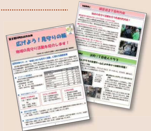
第5期区民会議で作成したパンフレット

また、見守り活動を行っている支援者自身が作成し、見守り活動に活用できる「(仮称)見守り支援マップ」の作成方法等の提案を掲載することに向けた検討をしていきます。