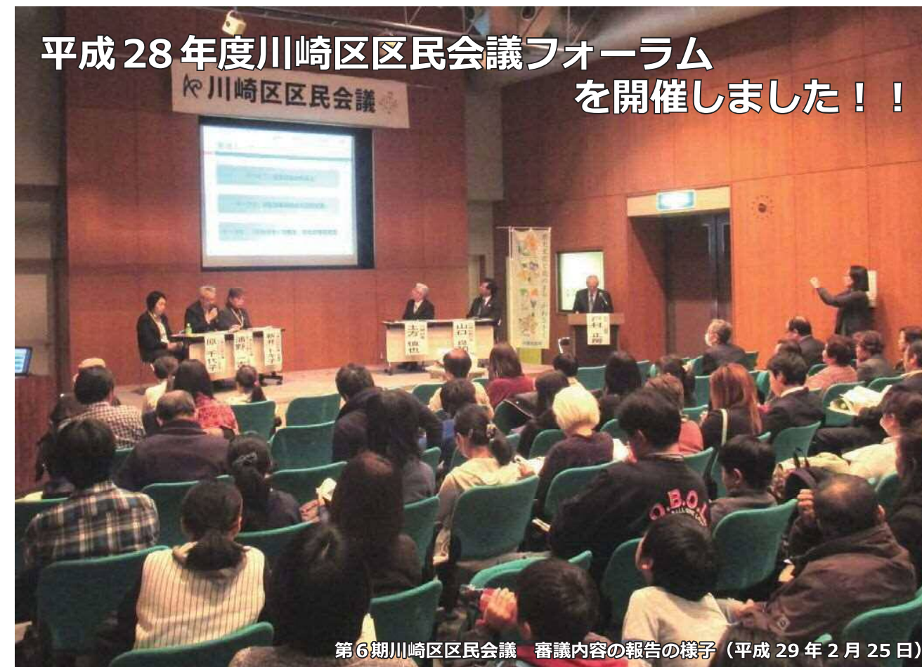
第6期川崎区区民会議 審議内容の報告の様子(平成29年2月25日)

区民会議の審議内容を区民に広く周知するとともに、審議内容について区民から意見を伺うことを目的として、区民会議フォーラムを開催しました。