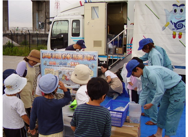
カップを着て降雨体験車の中へ

洪水や地震などの際に地域防災活動の拠点となる、ヘリポート、水防活動スペース、復旧用備蓄資材などを備えた施設。敷地内には市が管理する「大師河原水防センター」があります。「大師河原水防センター」は、洪水や地震などの災害時に復旧活動の拠点となるとともに、普段は多摩川の環境や防災について学ぶ場として活用されます。