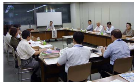
熱心な議論が行われた地域防災部会

第1期区民会議は19年度の審議テーマを「地域コミュニティの充実」とし、「地域防災部会」と「シニアパワー部会」を設けて審議しました。「地域防災部会」では地域の力で災害から街を守る方法について議論され、その中で新たに転入されてきた住民も交えての総合防災訓練を行うべきだという提案がありました。今回訓練の行われた大師河原は、近くに大規模マンションが建設されて間もないとあって区民会議でも注目しており、当日は区民会議委員も訓練に参加しました。