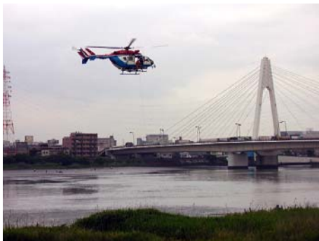
ヘリコプターによる救助訓練も

土のうの作り方や流水侵入の防ぎ方などを学べる家庭防災訓練のコーナー、AED（自動体外式除細動器）の扱い方などを紹介した救急救命訓練のコーナーなどのほか、降雨体験車や自然災害体験車などの特殊車両も登場しました。