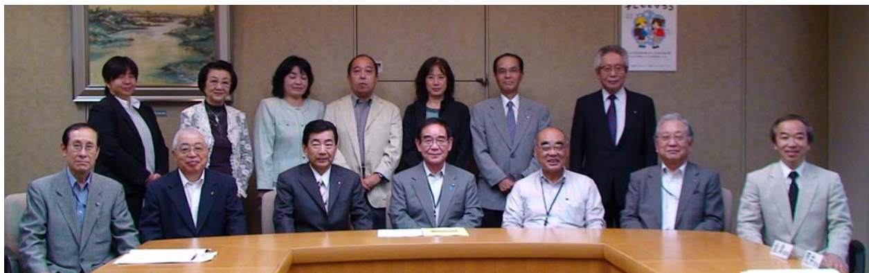
第1期委員のみなさん、2年間お疲れ様でした