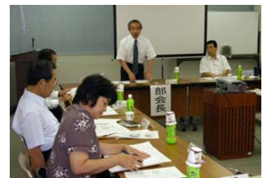
活発な意見が飛び交ったシニアパワー部会

現在区内では大規模マンションの建設が続いています。人口が急増した地域では、人間関係が希薄になると同時に、地域活動の担い手が不足することが懸念されます。このような中、多様な経験や知識をお持ちのシニア世代が、地域で力を発揮することが期待されています。区民会議ではこうした観点から、「地域コミュニティの充実」のテーマの下、「シニアパワー部会」を設けて議論を深めました。今回のツアーは、「シニアパワー部会」での議論を基に企画されたものです。