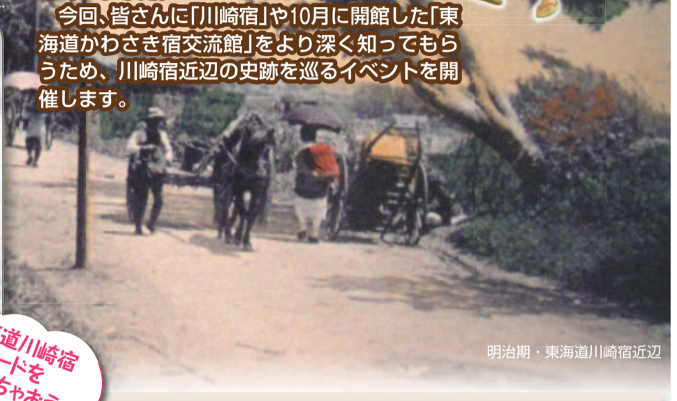
明治期・東海道川崎宿近辺