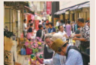
多くの人でにぎわう朝市