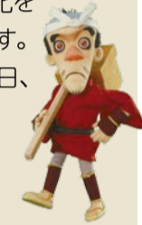
東海道かわさき宿交流館公認キャラクター「六さん」

申込 2月20日(必着)までに、住所、氏名、年齢、電話番号を記入し往復ハガキで。[抽選] ※東海道かわさき宿交流館のホームページ(お問い合わせのメールフォーム)からも申し込みます