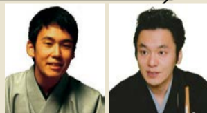
金原亭駒六 初音家左吉