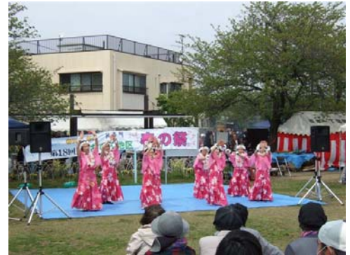
【お祭り気分を盛り上げる賑やかなステージ】

国際色豊かなおおひん地区ならではの各国の郷土料理の出店や、フリーマーケット、そしてステージでは、子どもたちによるダンス、和太鼓演奏、また地域のバンドグループの演奏など、会場をわかせていました。