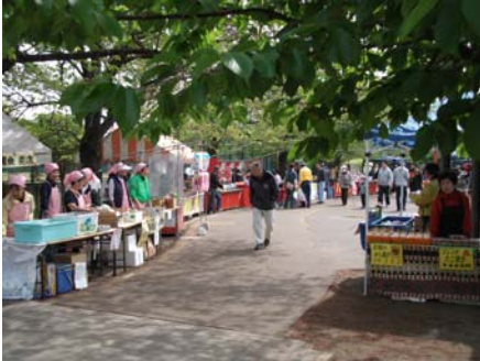
【各国の郷土料理の出店】

桜の時期は終わってしまいましたが、家族連れやお年寄り等多数のお客様にご来場いただきました。