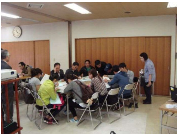
言語別のグループで緊急連絡カードを作成