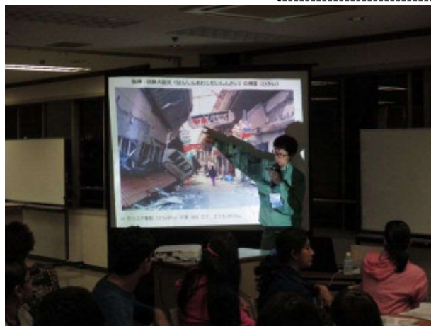
映像を交えて、過去の震災の教訓を学びました。