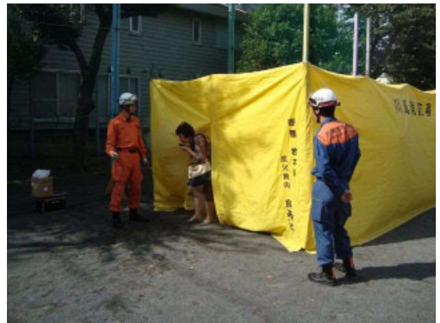
煙体験ハウスや水消火器を使った訓練を実施