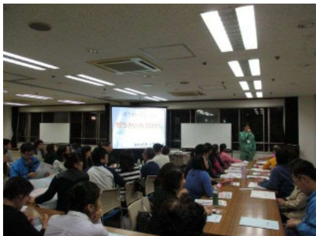
会場は満席。大盛況でした。