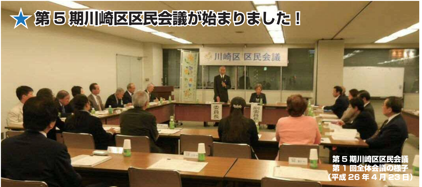
第 5 期川崎区区民会議 第 1 回全体会議の様子 (平成 26 年 4 月 23 日)

区民会議とは、暮らしやすい地域社会をめざして区民のみなさんが中心となって、参加と協働により地域社会の課題の解決を図るために調査審議をする会議です。