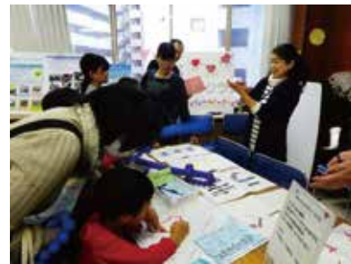
川崎区社協福祉まつり

活動への参加・体験・見学等を希望される方は、事務局までご連絡ください。今後の活動予定などをご案内させていただきます。