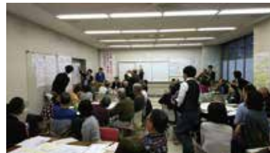
川崎のコミュニティのミライを考えるプロジェクト