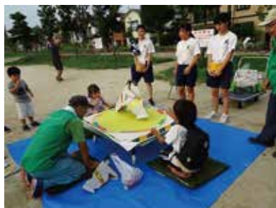
小田公園夏のお楽しみ大会(小田まちづくりクラブ)