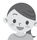
あるサポーターの声