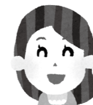
あるサポーターの声

サポーターといっても 手取り足取りサポートするのではなく、 グループで楽しむ「きっかけ」を 作ることを心がけています。 私も一員として一緒に 工作やバス旅行を楽しんでいます。