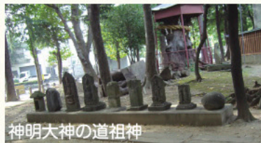
神明大神の道祖神

神明大神は、羽黒権現として明暦2(1656)年に建立し、明治に神明大神となりました。双体の道祖神等14像が裏手に並んでおり、中丸子を開いた歴史を偲ぶことができます。