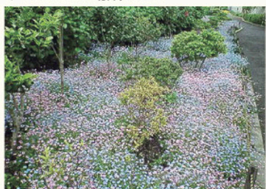
忘れな草の咲き揃う中丸子南緑道

渋川（シブッカ）を暗渠にした緑道です。地域の人達の努力で一年中花の絶えない公園となり、初夏に群れ咲くアジサイも見事です。玉川小学校の児童達による壁の絵も楽しい、やすらぎの場所です。