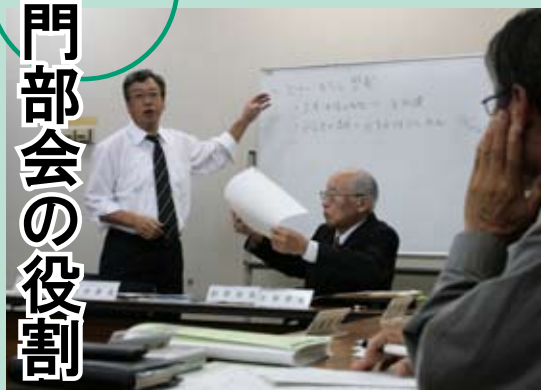
▲ 課題調査部会より

専門部会は、区民会議の調査審議をより専門的また機動的に行う必要がある場合などに設置し、区民会議から付託される事案の調査検討を行うものです。