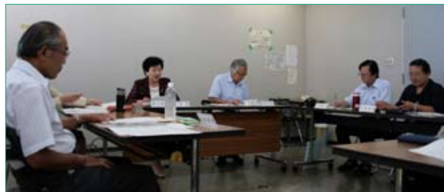
▲区の協働推進事業について、評価を行う部会委員のみなさん

中原区協働推進事業 *1 について、事業の実施結果と実施計画などに対して、区民会議としての評価を行うことを目的としています。