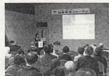
協働事業フォーラム