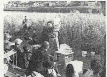
タカラモノを探そう エコツアー

■ 平成19年11月に幸市民協働プラザの利用促進と市民の協働の活性化を目的に、幸区協働事業フォーラム「れっつ協働～地域から発信～」を開催しました（約100名参加）。