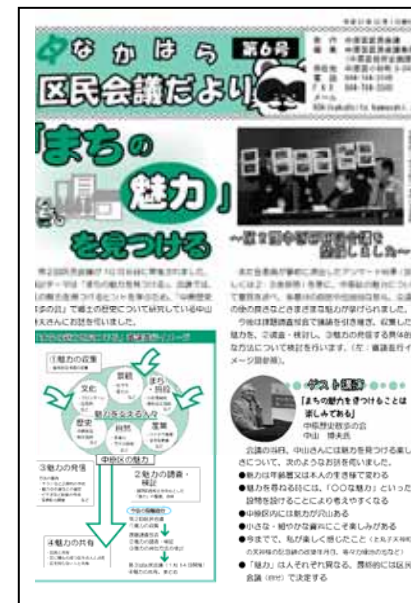
<区民会議だより第6号>

区民会議の審議や取り組みの様子を広く市民に伝えるために発行した。年4回の区民会議開催に合わせて発行し、中原区役所企画課の窓口で配布のほか、区内の町内会・自治会を通じて各戸に回覧を行った。