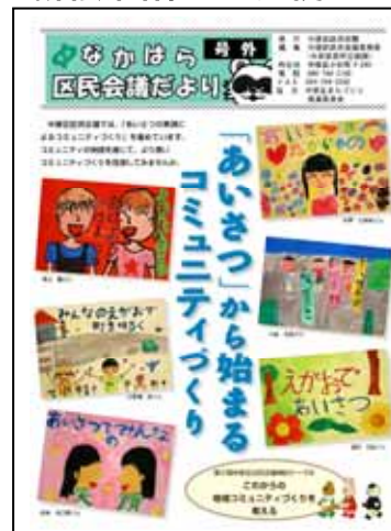
<あいさつポスター>

「地域コミュニティづくり」のテーマでは、「あいさつの実践によるコミュニティづくり」を区民会議の取り組みとして決定。まちづくり推進委員会が行っている「区内小中学校マナー・モラルアップポスター展」と連携し、あいさつポスターを作成し、あいさつを通じたコミュニティづくりの促進を目指しました。