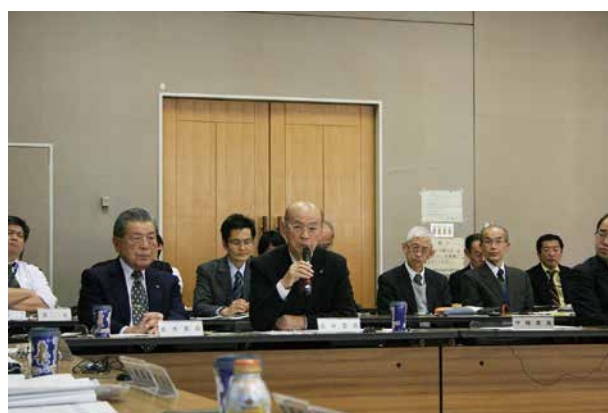
検討テーマについて意見交換