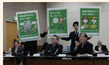
啓発ポスターの作成

自転車と共生するまちづくり委員会と共同で、「放置自転車のないまち通信」、啓発ポスターを作成し、中原区町内会連絡協議会を通じて各戸回覧やポスターの掲示をしました。