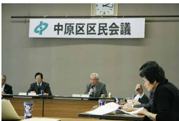
本会議での審議の様子

中原区区民会議の委員は、地域で様々な活動をしている団体からの推薦や、公募、区長推薦により選考された方たちが務めています。中原区に住む人々が暮らしやすく、笑顔があふれるまちづくりを目指して、地域の課題解決に向けた取組を行います。