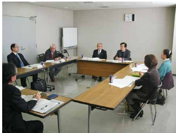
少人数での審議の様子