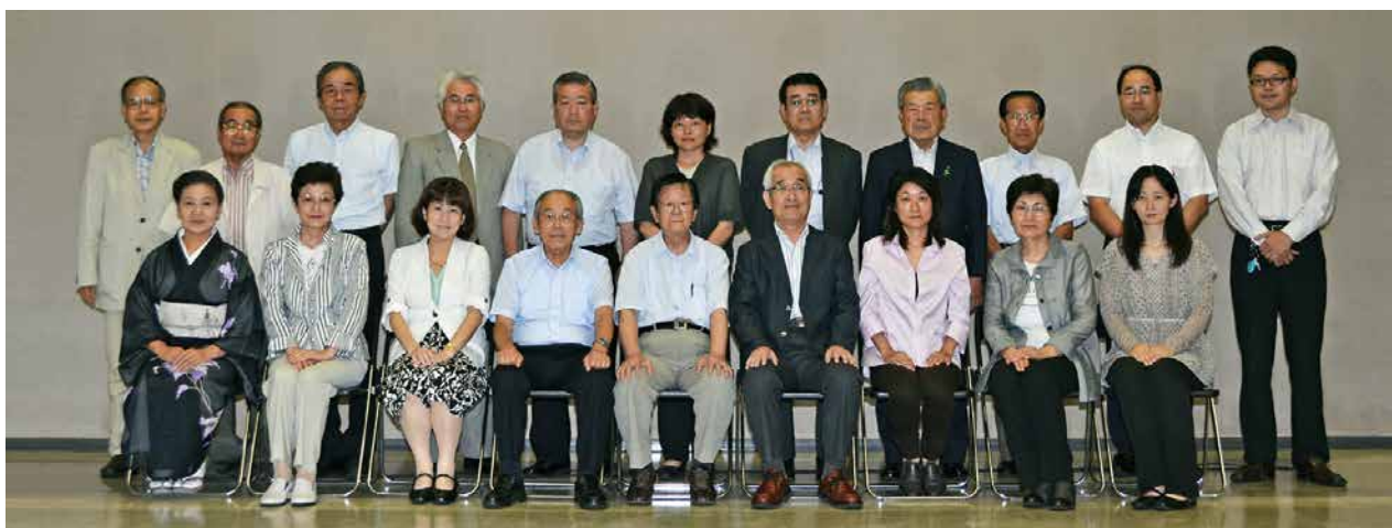
平成24年7月20日（金）第1回区民会議で撮影