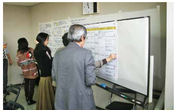
課題解決に向けた取組を議論