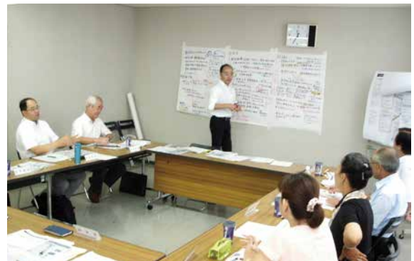
ワークショップ形式による意見交換

課題調査部会の審議報告を受け、区民 会議として検討テーマの解決に向けた 取組の提案を行う