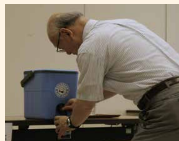
マイカップの利用

また、マイカップ利用を推進するために区民会議では、ペットボトルでのお茶の提供を廃止し、委員がマイボトルを持参することとしました。