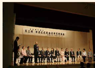
区民会議の成果と区内の魅力を発信

平成 24 年 4 月 1 日に区制 40 周年を迎えたことから、その記念事業の一つとして、区内の魅力を活かしたコンサートやダンスパフォーマンスなどを交えながら、第 3 期中原区区民会議の成果を広く区民に発信した「第 3 期中原区区民会議市民報告会」を平成 24 年 5 月 30 日に開催しました。