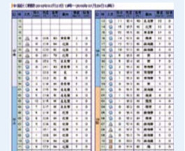
■ ピンポイント天気予報