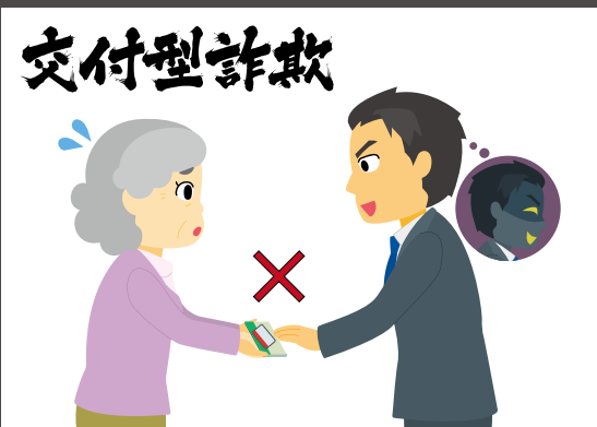
キャッシュカード交付型詐欺

犯人がデパート店員、警察官、金融庁職員などを装い、「あなたのキャッシュカードは不正に使用されています。カードを回収しに行きます」などと言い、自宅に直接取りに来る手口。