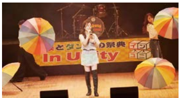
エポックなかはらで開催した昨年の様子