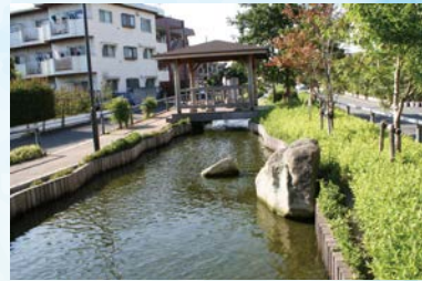
江川せせらぎ遊歩道(湧水の小径付近)