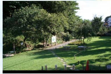
中原区市民健康の森