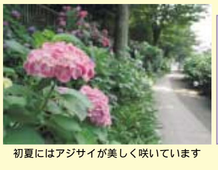
初夏にはアジサイが美しく咲いています

第七回なかはら市民活動祭のつどい「なかはらつば祭り」の出展者を募集します。市民活動を通して地域の交流の場づくりをしませんか。 日時 七月十六日(土)、