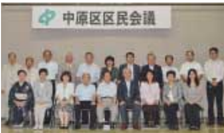
第4期区民会議委員

7月に第1回区民会議が開催されました。4期目を迎えた区民会議では、団体推薦、区長推薦、公募で選出された20人の委員が今後地域の身近な課題について話し合っていきます。