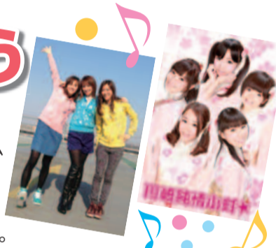
写真右から川崎純情小町☆、ちょっぴんず