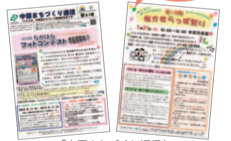
「中原まちづくり通信」で検索してください