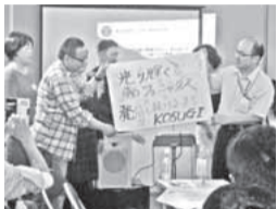
初めての人も楽しめます

圃8月5日(必着)までに往復ハガキかファクスに住所、氏名、年齢、 電話番号、メールアドレスを記入し〒211-0012中丸子112-3リエトコート武 蔵小杉リエトプラザ I、小杉駅周辺エリアマネジメント ☎433-9180、FAX 431-3135、[抽選]。圃区役所地域振興課 ☎744-3282、FAX 744-3346