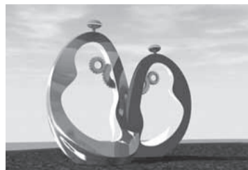
タイトル「家族の絆」、 テーマ「愛」

圃まちづくり局小杉駅周辺総合整 備推進室 ☎200-2988、FAX 200-3967