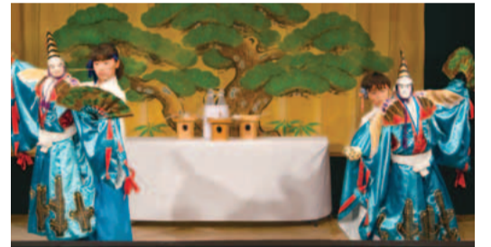
子どもたちによる公演の他、人形の解説も