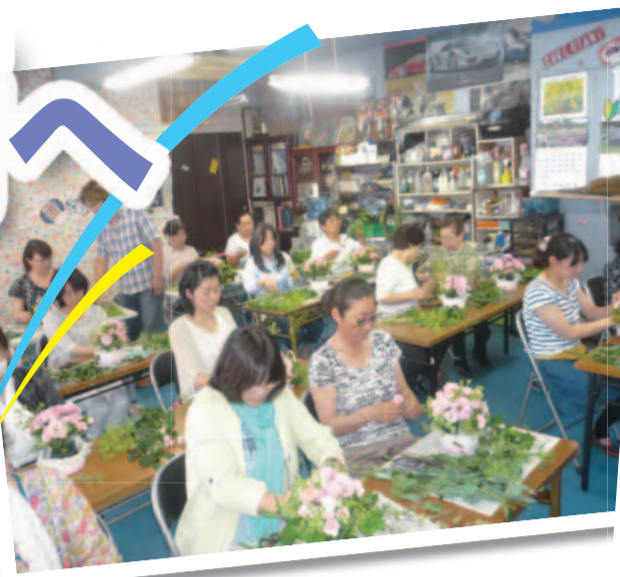
たくさんの花材からすてきなフラワーアレンジメントを作ります