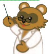
中原区区民会議キャラクター ためぎくん

日時 1月22日(木)14時~16時(開場13時半) 場所 区役所5階会議室 傍聴 当日先着50人 ☎区役所企画課 ☎744-3149、FAX 744-3340