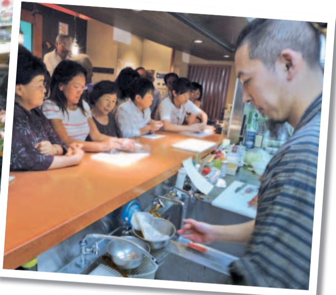
実演後は紹介した料理の試食を行います