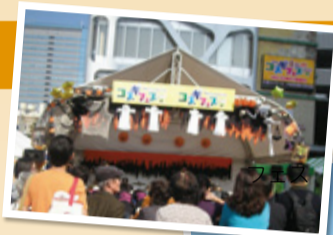
武蔵小杉駅周辺で 開催されるコスギ フェスタ

10月に入ると元住吉、新丸子、新城周辺などでは、商店街のお祭りで活気あるにぎわいを見せます。また、自然豊かな等々力緑地では、区民祭を開催。ステージ発表やパレードなどを行い、多くの区民でにぎわいます。