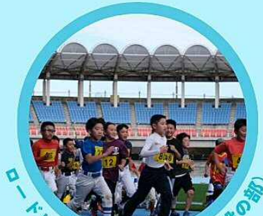
ロードレース (小学生の部/一般の部)