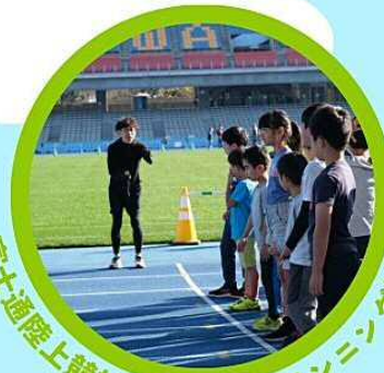
富士通陸上競技部Presents ランニング教室