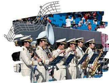
フォトスポットや 川崎市消防音楽隊による演奏も♪