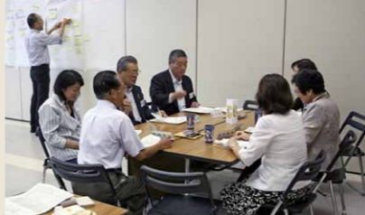
グループに分かれて交流をしました

委員の皆さんにとって初顔合わせの場となり、初めて選任された委員も再任された委員も緊張しつつも和やかな雰囲気に参加していました。