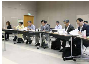
少人数で様々な意見を出し合います