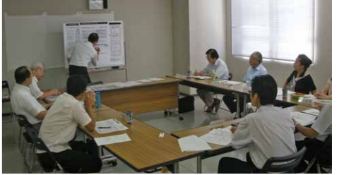
今後の運営方法などを話し合います