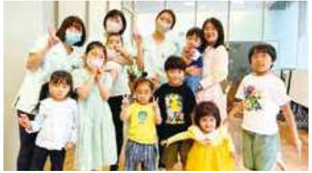
[子育てサロンコスギビーンズとの交流]

食べる・話す・呼吸する 生きる上で必要な機能を持つお口の成長は、赤ちゃんが産まれる前から始まっています。将来の健康なお口と元気な身体のために、歯科医師・歯科衛生士・保育士・管理栄養士・言語聴覚士などのスタッフが、お子さまのためのセミナー・スクールを開催しています。お口のケア方法・歯ならび・かみあわせ・食べ方・話し方に関するご相談もできます。お気軽にお問い合わせください。