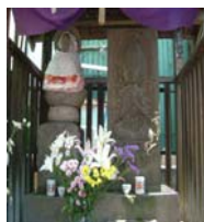
北向地蔵と 馬頭観音