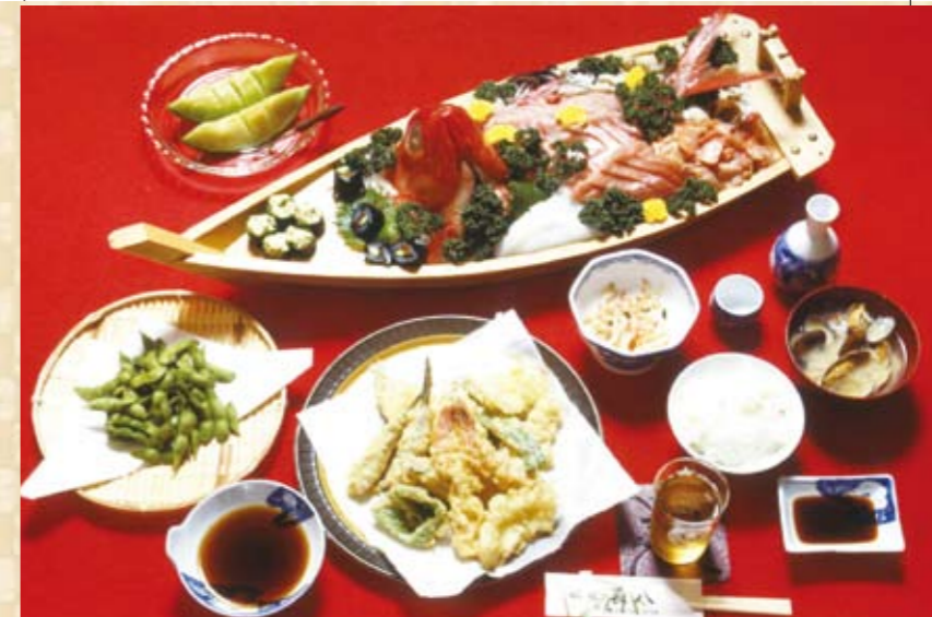
季節のプランのご案内