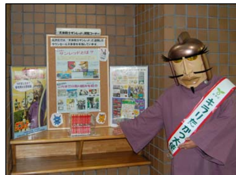
新設されたコーナー ここで寄贈本が閲覧できます