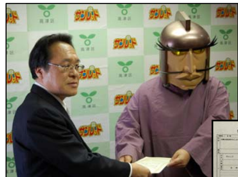
大使に就任したヴァンプ将軍と特別住民票