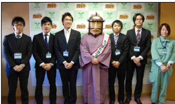
タウンセールス推進プロジェクトのメンバーと

高津図書館では、1月28日(金)から閲覧可能(禁貸出・郷土資料)。高津区役所の新設コーナーでも開庁時間(平日8時30分から17時まで)に閲覧できます。