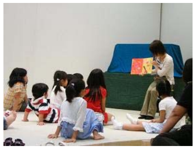
児童図書コーナー