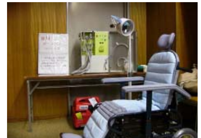
展示(歯科ポータブルユニット)