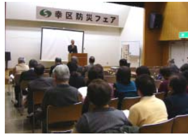
防災フェア講演会