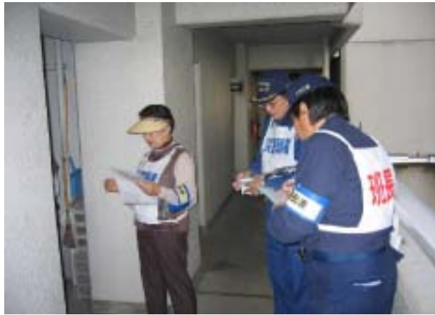
要援護者の安否確認訓練