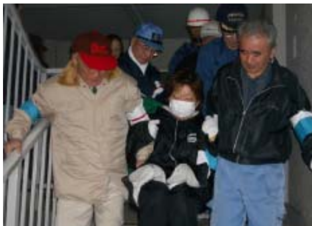
要援護者の移送訓練