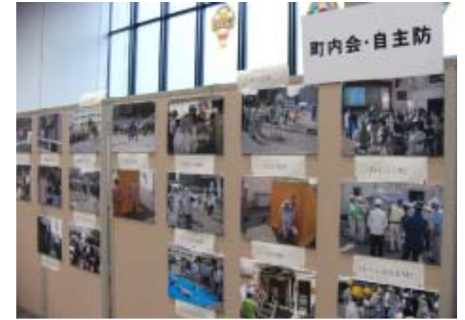
展示(町内会・自主防災連絡協議会)