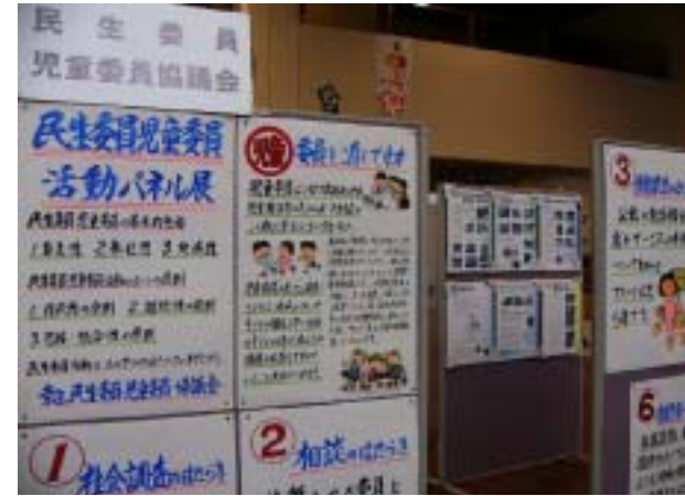
展示(民生委員児童委員協議会)