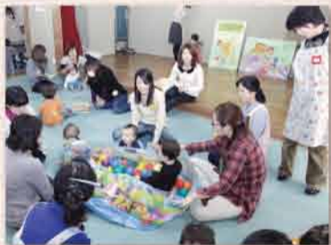
くつろげる雰囲気を大切に、温かく見守ります