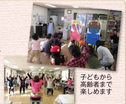
子どもから高齢者まで楽しめます