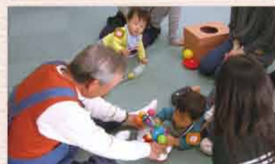
男性の委員さんはダイナミックな遊びで人気

同じ月齢の子を持つママ友が欲しいと思って参加しました。広いので子どもも伸び伸び遊べるし、ちょっと目を離しても委員さんたちが見てくれるので安心。子どもが小さいと室内で遊ぶことが多いので、こんな場所があつてとても嬉しいです。