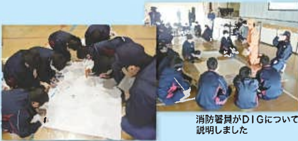
消防署員がDIGについて説明しました