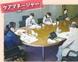
ケアマネージャー

民生委員児童委員、ケアマネージャー、地域包括支援センター等の地域福祉に携わる皆さんからは、「見守り活動に携わる人が足りない」「異変を感じたら、すぐに連絡をしてもらえると助かる」といった声がありました。