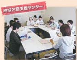
地域包括支援センター