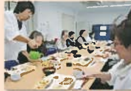
おいしい食事で会話が弾みます

会食会に参加しなかった人の安否確認など、様々な形による見守り活動が行われていることなどが分かりました。