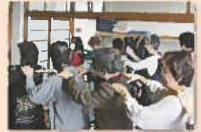
いつものメンバーで体を動かします