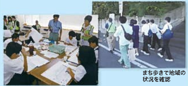
まち歩きで地域の状況を確認

でき上がったマップを各家庭に持ち帰ることで、地域の防災情報の共有と防災意識の向上が図れました。