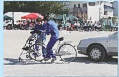
横断歩道を渡るようとする歩行者と自転車の衝突の再現

幸区リレーカーニバルにおいて開催し、多くの人たちに、交通事故の恐ろしさを、肌で感じてもらうことができました。