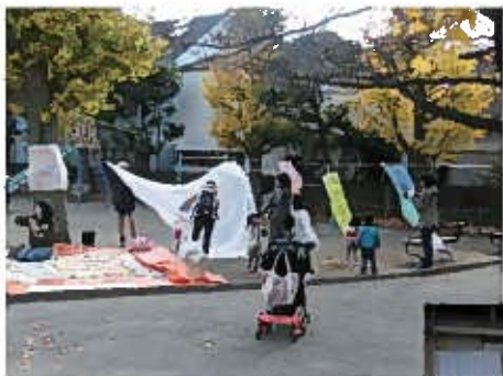
身近な公園を活用した、子どもや保護者同士が遊びながら交流できる場の提供

区民と行政の「協働」によるまちづくりにつなげるための「提言」を受け、区内で具体的な取組がなされました。