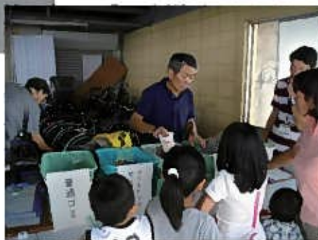
ゴミの分別を楽しみながら学んでもらうゲームの実施