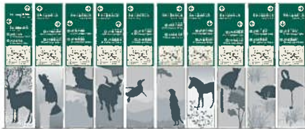
夢見ヶ崎公園への案内サインの設置