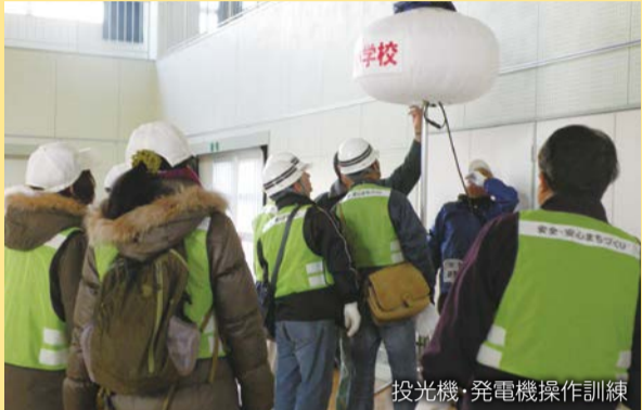
投光機・発電機操作訓練

多様化、頻発化する自然災害。被害を少しでも減らすためには、「市民」「地域」「行政」が互いに連携しながら取り組み、防災力を高める必要があります。家庭や地域で防災について考え、実践しましょう。 区役所危機管理担当 ☎556-6610、FAX555-3130