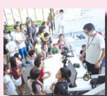
大人も子どもも楽しめます

日時 9月10日(出)10時～16時(雨天決行) 会場 慶応義塾大学新川崎タウンキャンパス、かわさき新産業創造センター