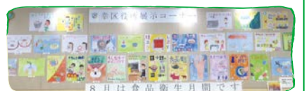
色とりどりのポスター(昨年度)

展示期間 ①8月9日～9月5日 ②9月6日～10月3日 ※①②の期間にバス車内に各15枚程度展示します 区交通局管理課 ☎200-3238、FAX200-3946